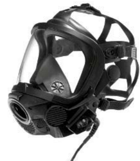
Dräger FPS-COM Einheit

Dräger FPS-COM – ein weiteres Qualitätsprodukt von Dräger.