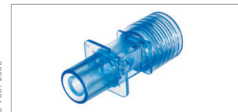
CO 2 -Einwegküvette, Erwachsene